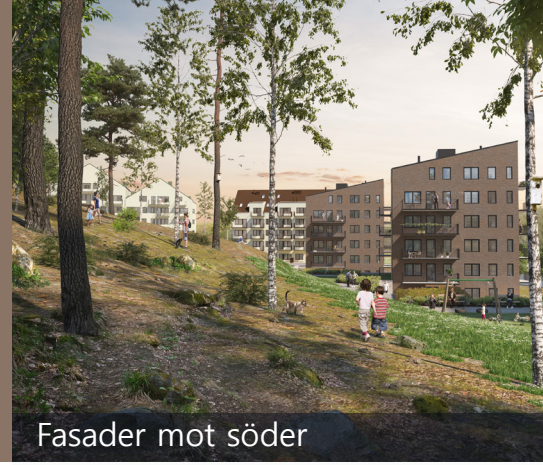
Fasader mot söder