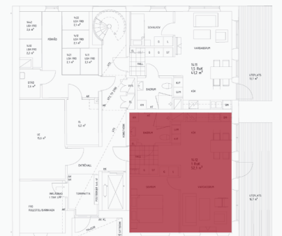
Läge i fastigheten